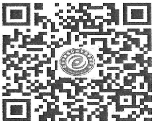
(微信公众号二维码)